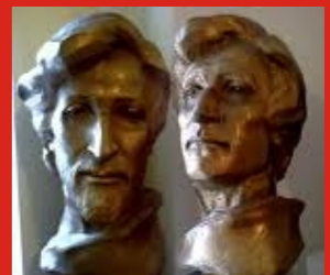
Socha Milana Knoblocha dle antropologické rekonstrukce