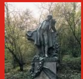
Socha Máchy od Josefa Václava Myslbeka