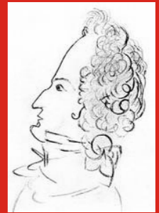
Domnělý Máchův autoportrét